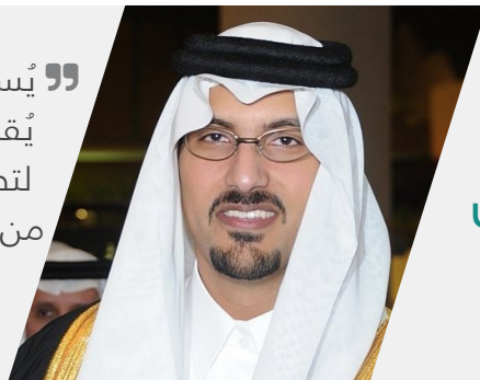
صاحب السمو الملكي الأمير سعود بن خالد الفيصل

”يسعدني أن هناك برنامج تعليمي تنفيذي عالي المستوى يُقدم في المدينة المنورة. لقد وجدت البرنامج المتقدم لتطوير المهارات القيادية والإدارية ذو تجربة غنية وفريدة من نوعها لمست الجوانب الذهنية، والروحانية، والعاطفية، والجسدية من جوانب التنمية القيادية“