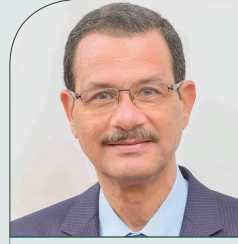
د/ أحمد درويش

وزير التنمية الإدارية سابقاً، جمهورية مصر العربية