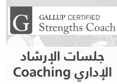
جلسات الإرشاد Coaching الإداري