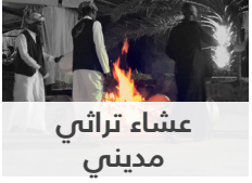
عشاء تراثي مديني

سيتم التركيز على منهجيات وممارسات تطوير السياسات العامة لتكون فعّالة في خدمة المجتمع و المعنيين من ذوي العلاقة. وتغطية جميع مراحل إعداد السياسات العامة وتشتمل على تمارين جماعية للمشاركين من خلال استخدام دراسات حالة عملية من واقع تجربة حكومة دبي والإمارات وبعض الدول المختارة وذلك بهدف تبادل المعرفة والخبرات وتعزيزها لدي جميع المشاركين. وسوف يتمكن المشاركون من القدرة على تطوير وتنفيذ السياسات العامة المستندة إلى أدلة علمية واستخدام التحليل والأدلة البحثية لتطوير السياسات العامة بشكل استراتيجي، وكذلك الابتكار وتطبيق أفضل الأساليب في عملية تطوير وتنفيذ السياسات العامة.