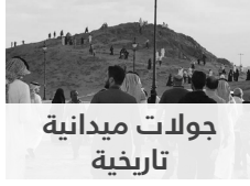
جولات ميدانية تاريخية