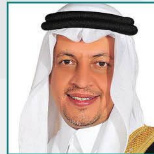
معالي وزير التخطيط والاقتصاد محمد بن مزيد التويجري