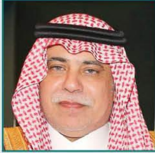
معالي وزير التجارة والاستثمار ماجد بن عبد الله القسبي