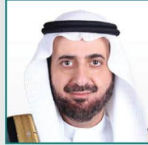
معالي وزير الصحة د. توفيق بن فوزان الربيعة