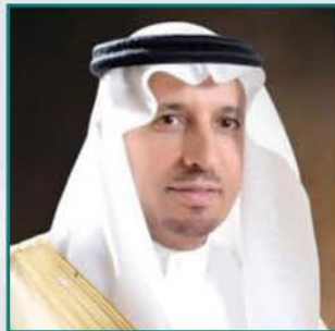
معالي وزير العمل والتنمية الاجتماعية علي بن ناصر الغفيص