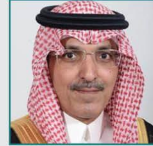
معالي وزير المالية الأستاذ محمد عبد الله الجدعان